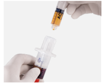
Bereit zur Injektion